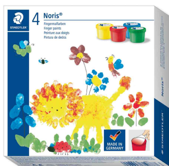
Fingerfarbe Noris MALI, 4er Kartonetui