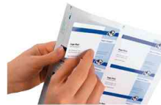
Am PC gestalten - ausdrucken - einfach ablösen