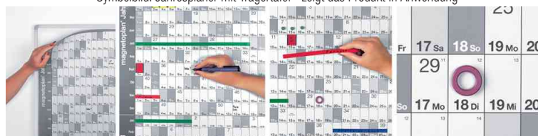
schneller Gesamtüberblick - einfache Handhabung - magnethaftende Detailplanung