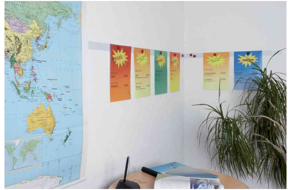
Zeigt das Produkt in der Anwendung