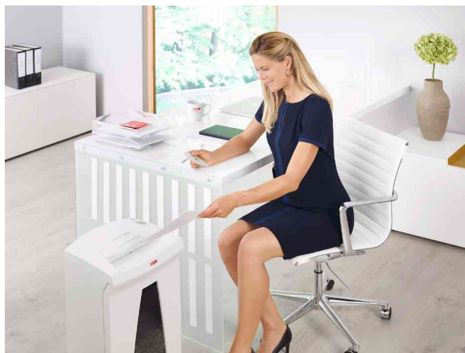
Aktenvernichter HSM SECURIO B34