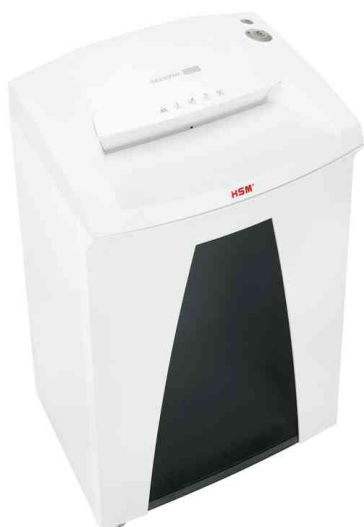
Aktenvernichter HSM SECURIO B32