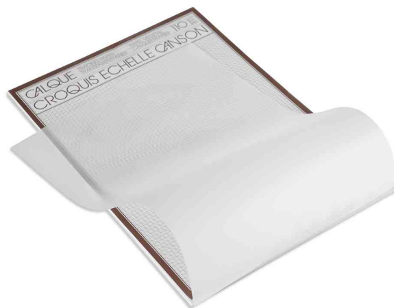
Deckblatt kann als Unterlage genutzt werden