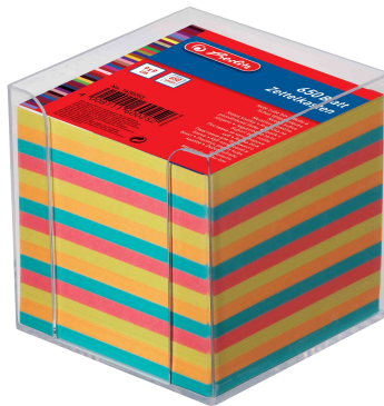
Zettelbox transparent, Papier farbig