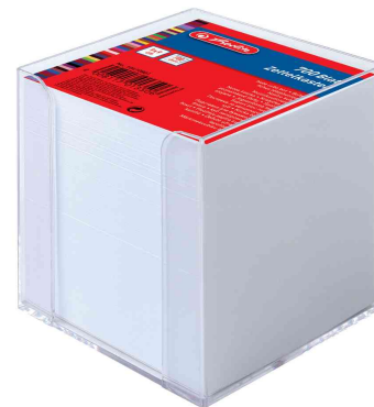
Zettelbox transparent, Papier weiß