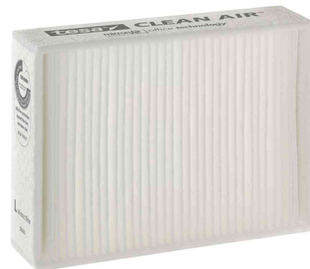
Feinstaubfilter "CLEAN AIR®", Größe L