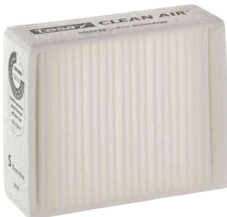
Feinstaubfilter "CLEAN AIR®", Größe S