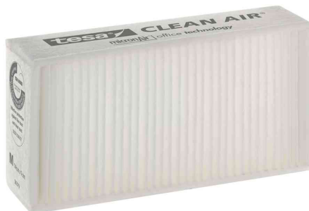
Feinstaubfilter "CLEAN AIR®", Größe M