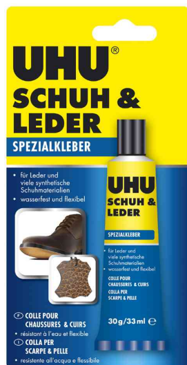
Spezialkleber SCHUH &amp; LEDER