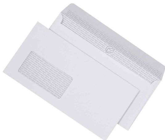
Briefumschlag "MAILdigital", DIN lang

- optimal bedruckbar auf Laserdruckern, Fotokopierern und Inkjetdruckern