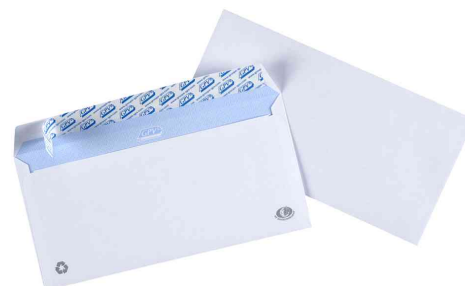
Symbolbid: Briefumschläge, Großpackungen