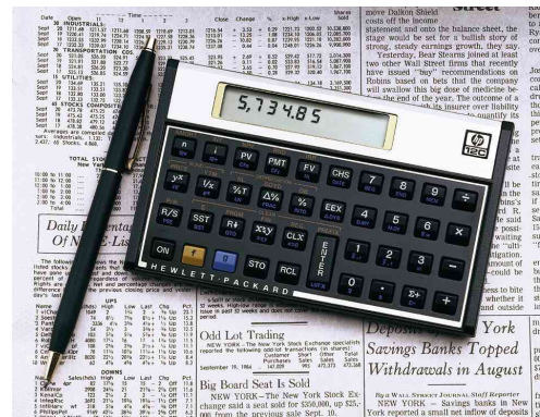
HP 12c Platinum, Anwendung