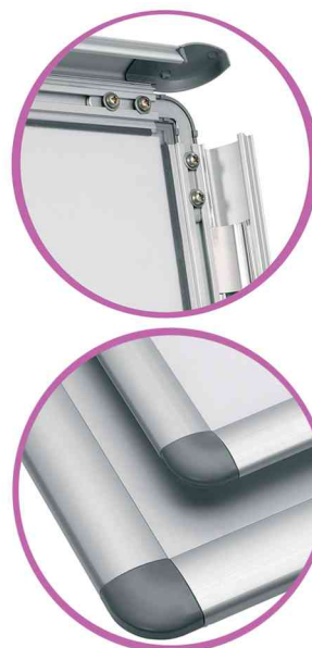
Detailansicht: hochklappbarer Rahmen