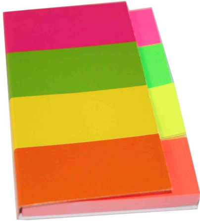
Pagemarker - Papier