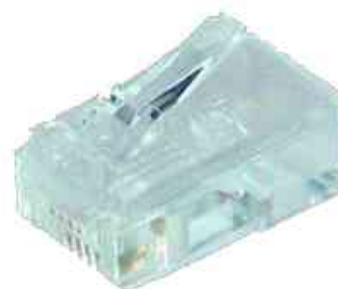
RJ45 Modular-Stecker, ungeschirmt