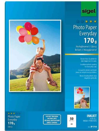
Inkjet-Foto-Papier "Everyday", 170 g/qm, 50 Blatt