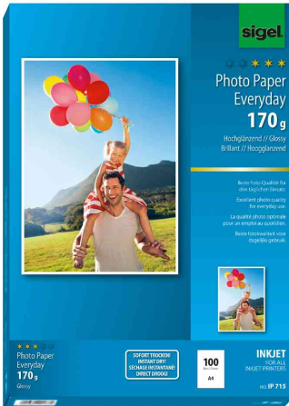
Inkjet-Foto-Papier "Everyday", 170 g/qm, 100 Blatt