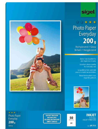
Inkjet-Foto-Papier "Everyday", 200 g/qm, 50 Blatt