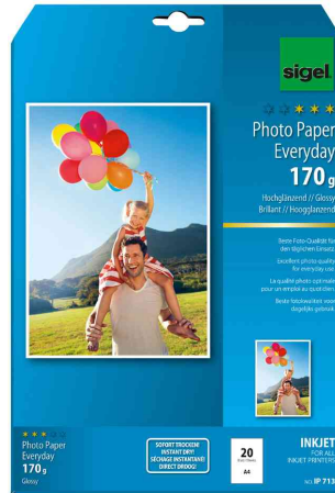
Inkjet-Foto-Papier "Everyday", 170 g/qm, 20 Blatt