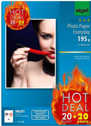
Inkjet-Foto-Papier "Everyday" "HOT DEAL"