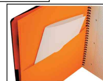
Lochung A5 - versetzbares Register - praktische Tasche