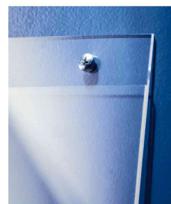
Auch zum Anschrauben an der Wand geeignet