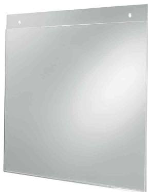
Plakattasche, A4 quer