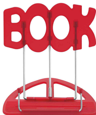
Leseständer BOOK, rot