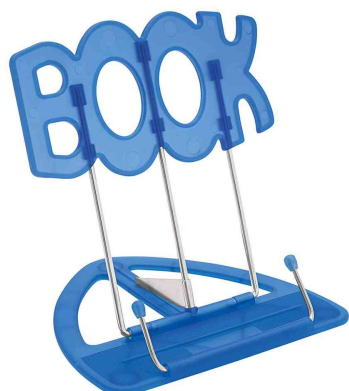
Leseständer BOOK, blau