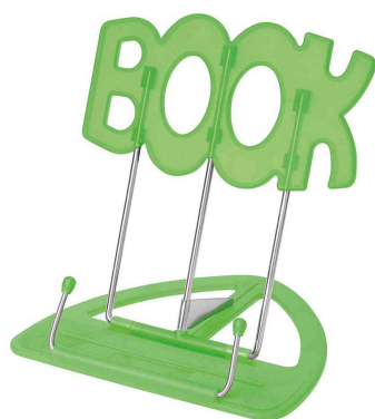
Leseständer BOOK, grün