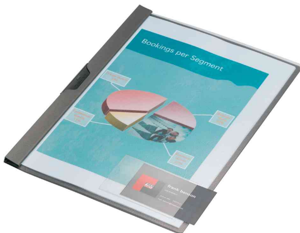
Selbstklebetaschen POCKETFIX®, Anwendungsbeispiel