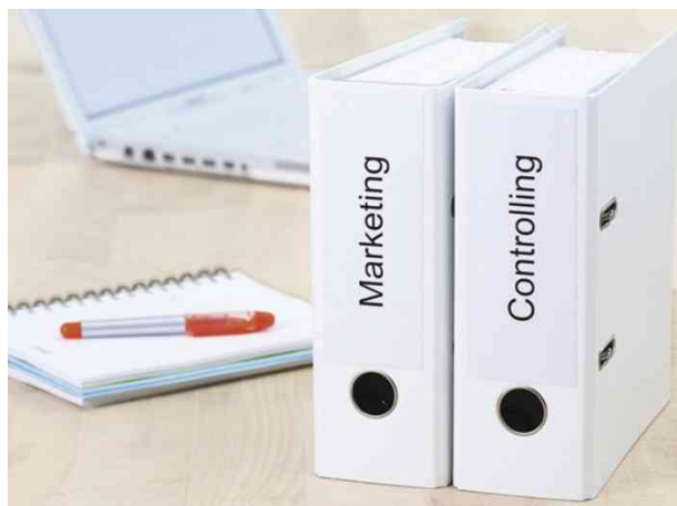
Orderrücken-Etiketten SPECIAL, Anwendung