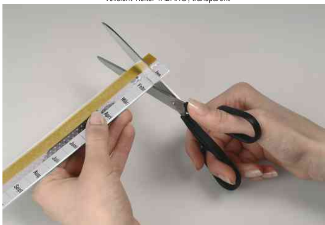
Zuschneidbar auf erforderliche Breite