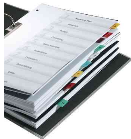
Vollstreiter TABFIX®, Anwendungsbeispiel