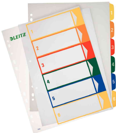
Zahlen Kunststoff-Register, 6-teilig