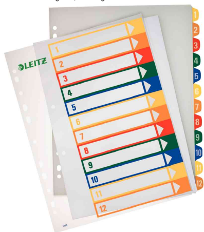
Zahlen Kunststoff-Register, 12-teilig