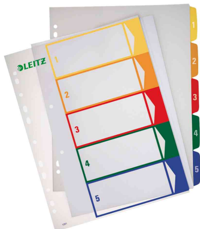
Zahlen Kunststoff-Register, 5-teilig

Hinweis: kostenlose Word-Formatvorlage steht unter www.leitz.com zum Download zur Verfügung