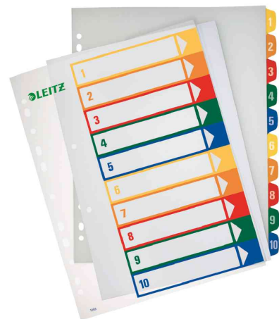
Zahlen Kunststoff-Register, 10-teilig