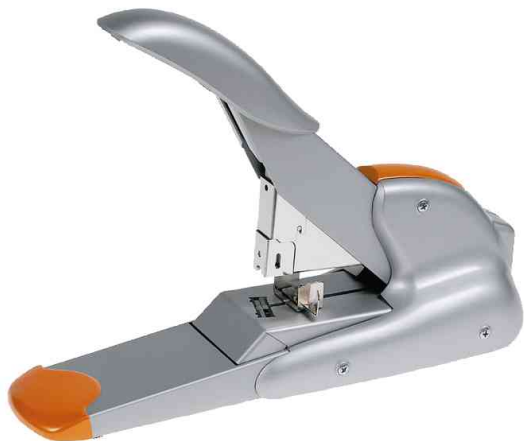
Blockheftgerät Supreme DUAX

- ideal, wenn unterschiedlich dicke Stapel Papier zu heften sind