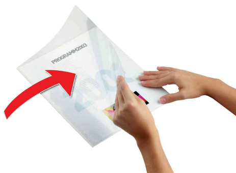
4. Den Vorderdeckel nach rechts zurückklappen