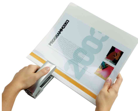
1. Markierten Stellen mit einem Hefegerät klammern