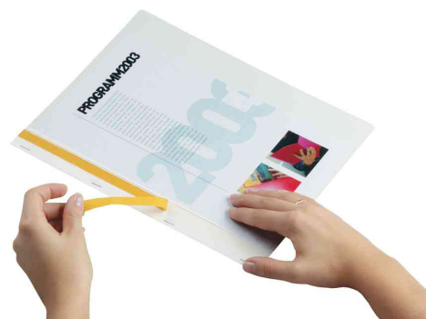
2. Schutzfolie vom Klebestreifen entfernen