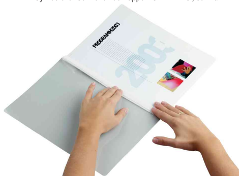
3. Den Vorderdeckel einklappen