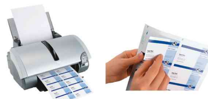
Am PC gestalten - ausdrucken - einfach ablösen