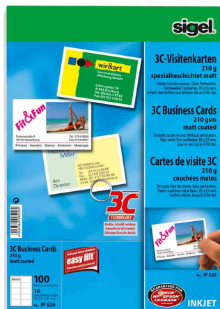
Visitenkarten, spezialbeschichtet matt