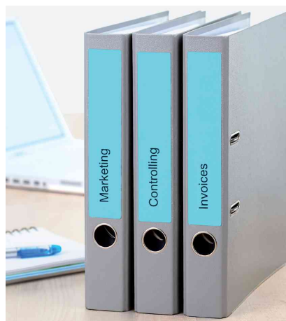
Orderrücken-Etiketten SPECIAL, Anwendung