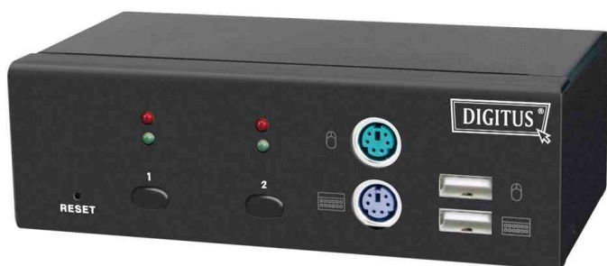
KVM Switch USB / PS/2, 2-fach