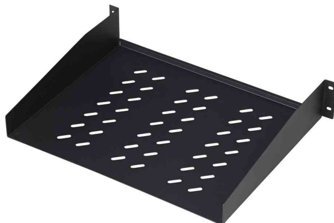
19" Fachböden, 2 HE, Festeinbau, schwarz