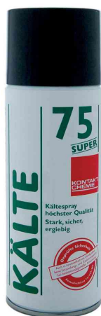
Kältespray "KÄLTE 75 SUPER"