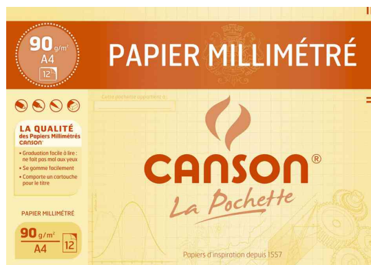
Millimeterpapier DIN A4, dunkelbraun