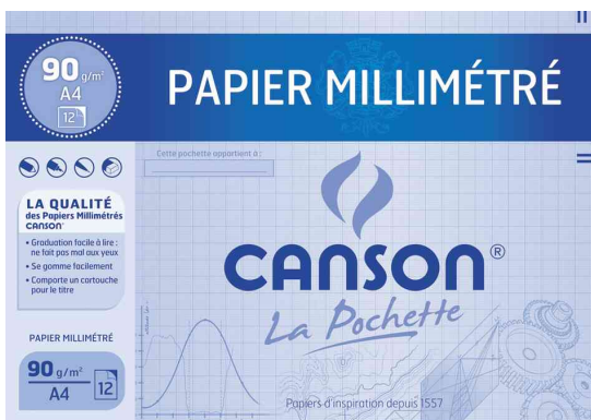
Millimeterpapier DIN A4, blau