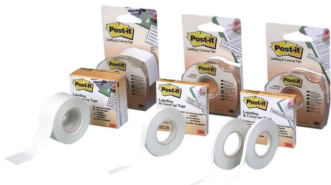
Abdeck- und Beschriftungsband

- Der Handspender mit dem Post-it® Abdeck- und Beschriftungsband ist schnell zur Hand und hilft zuverlässig beim Abreißen des Bandes