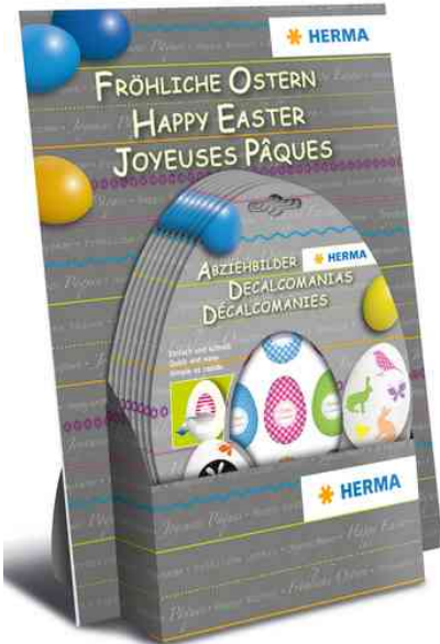
Oster-Abziehbilder TREND, im Thekendisplay

Bestückung Karton-Display: 20 Packungen à 2 Designs